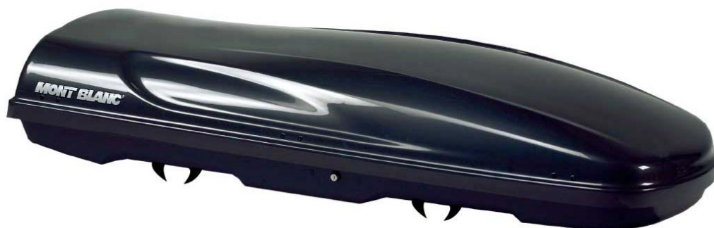
TRITON 650+ Svartmetallic

Med Dual Opening öppnas boxen enkelt från antingen höger eller vänster sida, vilket underlättar såväl montering som i- och urlastning av packningen.